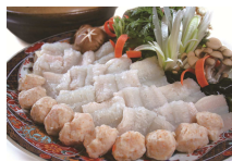
はも・フィレを 使ったはも鍋 （株式会社ヒロ・ コーポレーション）