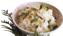
天然鳴門鯛の 鯛めし （株式会社さわ）