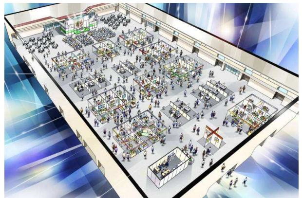
農商工連携の“宝さがし” in 香川 イメージ図